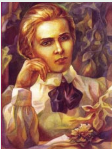
Леся Українка. Художник - Лариса Іванова, 1961 р.

25 ЛЮТОГО МИНАЄ 140 РОКІВ ВІД ДНЯ НАРОДЖЕННЯ ЛЕСІ УКРАЇНКИ