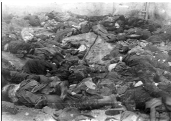
Листопад 1941 р. Подвір'я тюрми Бригідки.

У 1930 р. з під його пера виходить стаття „Життя Українців Румунії“, яку поміщено в часописі „Поступ“. У ній дослідник змальовує українське життя на Буковині в період з листопада 1918 року і до 1928 року та зміни,