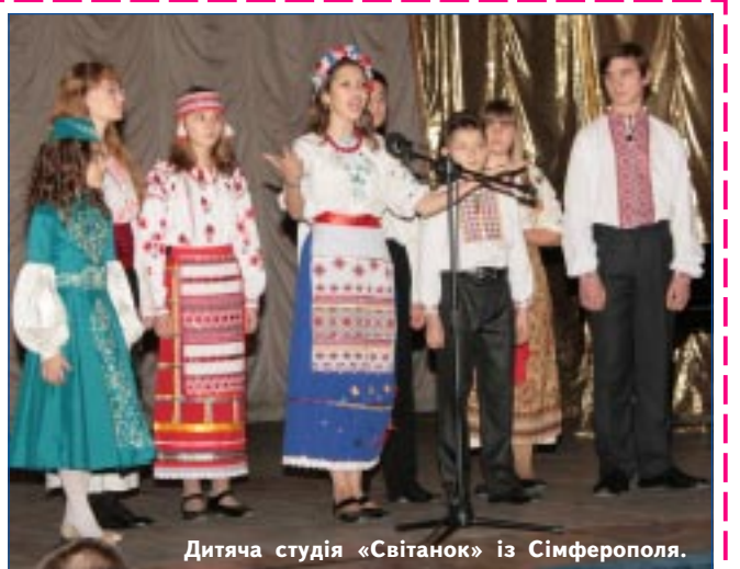
Дитяча студія «Світанок» із Сімферополя.