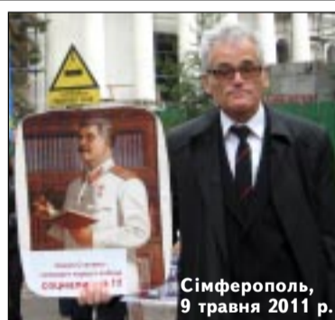
Сімферополь, 9 травня 2011 р.

Відповідні офіційні звернення Світовий конгрес українців надіслав Президенту Європейського Парламенту Ежи Бузеку, Президенту Європейської Ради Герману ван Ромпею, Президенту Європейської Комісії Жозе Мануелу Баррозу, генеральному секретарю Ради Європи Торбйорну Яглану, чинному голові ОБСЄ Аудрону Ажубалісу, єврокомісару з питань розширення та політики сусідства Стефану Фюле, голові делегації Європейського Парламенту до Комітету парламентського співробітництва ЄС-Україна Павелу Ковалю, голові Підкомітету Європейського Парламенту з питань прав людини Гейді Гауталі, комісару Ради Європи з прав людини Томасу Гаммарбергу та директору Бюро демократично-людських прав ОБСЄ Джанезу Ленарчику.