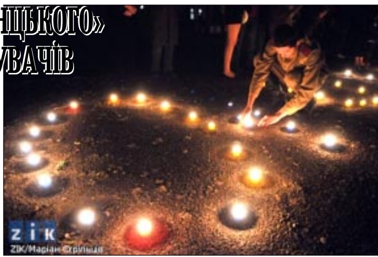
ZIK ZIK/Marijan Strpljanec

На другому поверсі музею з великого екрану