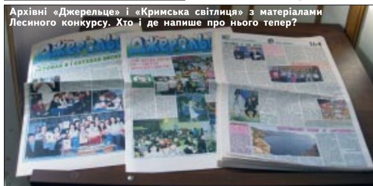
Архівні «Джерельце» і «Кримська світлиця» з матеріалами Лесиного конкурсу. Хто і де напише про нього тепер?