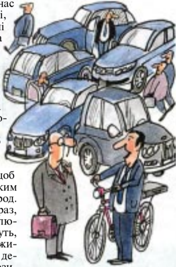
— До Верховної Ради півгодини їзди, то краще сюди на велосипеді добратися. А свій «Лексус» я лікарні подарував.

Мал. А. Василенка. (З циклу «Неймовірні ситуації».)